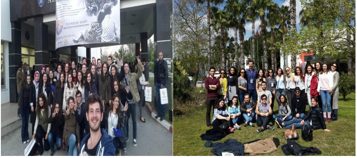
Foto : 6. Öğrenci Kurultayı

TMMOB Çevre Mühendisliği Odası Öğrenci Komisyonu'nun her iki yılda bir farklı illerde düzenlediği öğrenci kurultayı bu sene 20-21 Martta Antalya Akdeniz Üniversitesi'nde yapıldı. Türkiye'nin birçok ilinden gelen Çevre Mühendisliği öğrencisi Çevre Mühendisleri Odası'nın düzenlemiş olduğu 6. Öğrenci Kurultayı'nda buluştu.